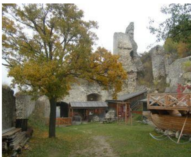
Nádvoří a věž hradu

Falkenstein je stará vinařská obec, kde se na okolních vápencových svazích pěstuje víno už od roku 1309. Oblast má lehké vápenité půdy a výborné mikroklima, vhodné pro pěstování kvalitních vín, zejména bílého vína. Typické víno je místní Falkensteiner, které stojí za to ochutnat. Falkenstein byl sídlem vinařské správy pro oblast mezi Vídní a Brnem v období od 13. do 18. století, vinařská správa nebo vinařský soud byl jakousi obdobou horní správy, dodnes je v místním archívu uchována jednací kniha z roku 1584.