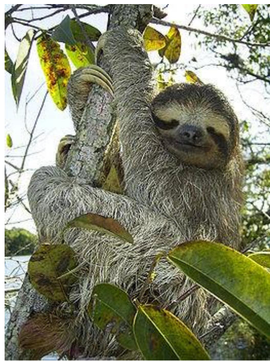
Lenochod hnědokrký ( Bradypus variegatus ) – wikipedia